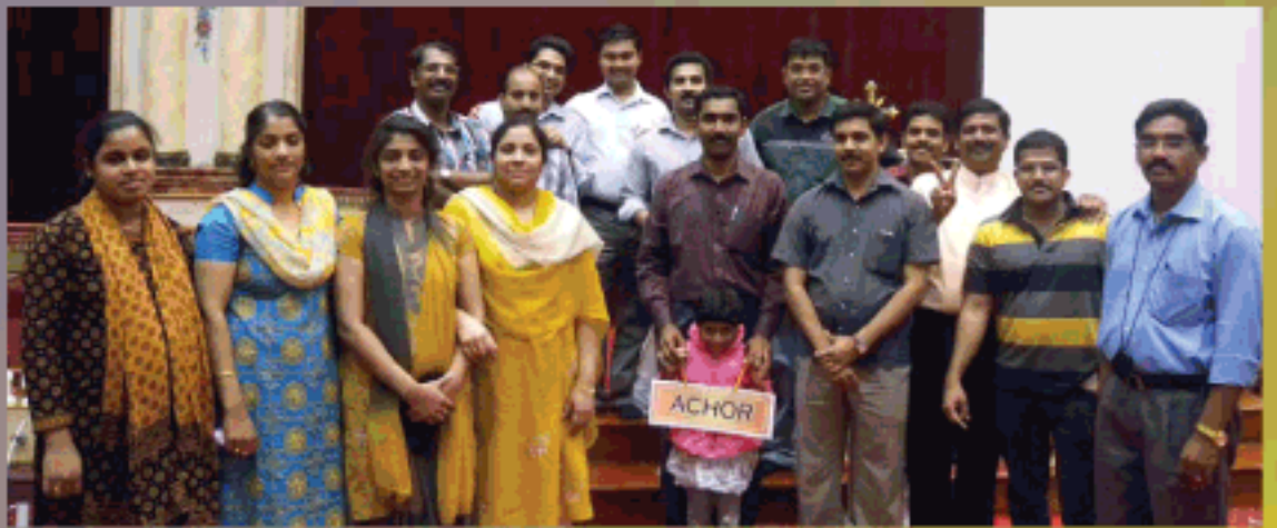
യൂത്ത്ഫെസ്റ്റ് 2012, ബൈബിൾ ക്വിസ് മത്സര വിജയികൾ (മാർച്ച്)