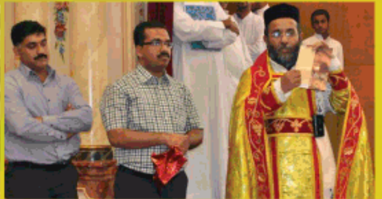
ബൈബിൾ റീഡിംഗ് കാർഡ് പ്രകാശനം