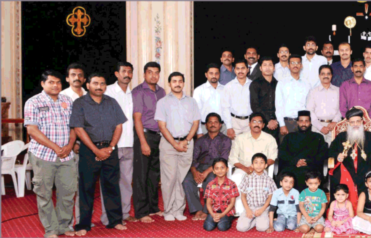
പ്രസ്ഥാന അംഗങ്ങൾ പ. ക