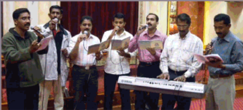
സമർപ്പണ പ്രാർത്ഥന (ഗാന ശുശ്രൂഷ)