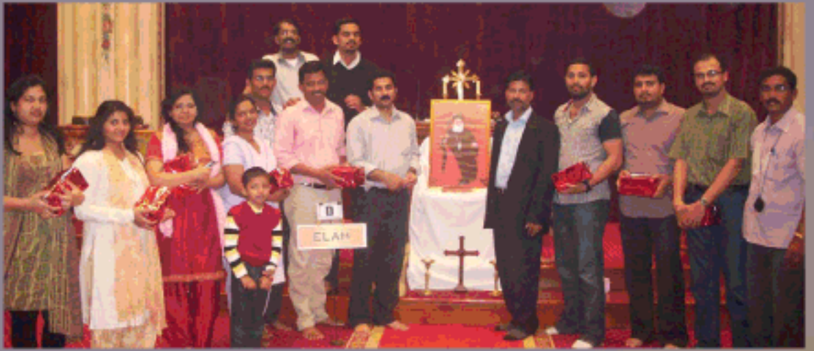
യൂത്ത്ഫെസ്റ്റ് 2012, ബൈബിൾ റഫറൻസ് മത്സര വിജയികൾ (ഫെ(ബ്രുവരി))