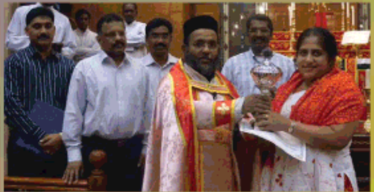
പ. ബസേലിയോസ് മാർത്തോമ്മാ മാത്യൂസ് ജിതീയൻ ബാവാ അനുകൂലന പ്രസംഗമത്സരം