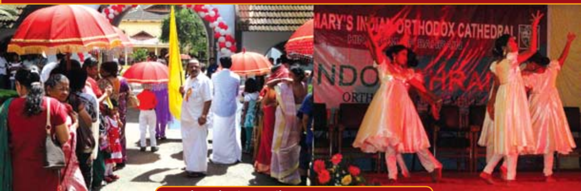
Indo Bahrain Family Meet-2 at Kottayam