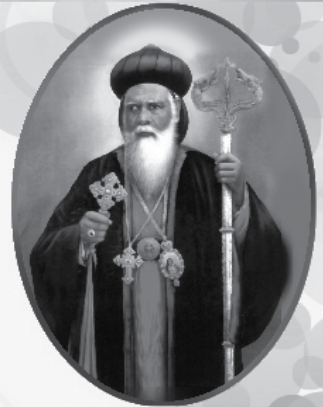
St. Geevarghese Mar Dionysius Vattasseril

സ്മൃതി SMRUTHI കലാ കായികമേള ARTS & SPORTS FESTIVAL