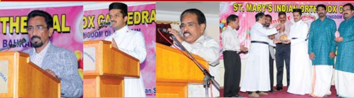
Summer Fiesta'13 - Finale