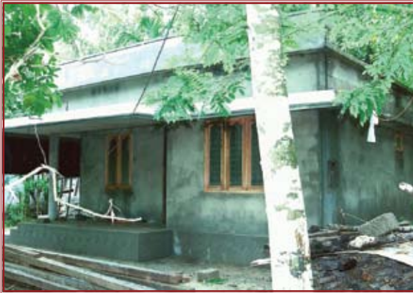
PRAKASH (Cathedral Roll. No. 1893) KANKALIL HOUSE CHEPPAD P.O, EVOOR NORTH, ALLEPPEY (Dist)