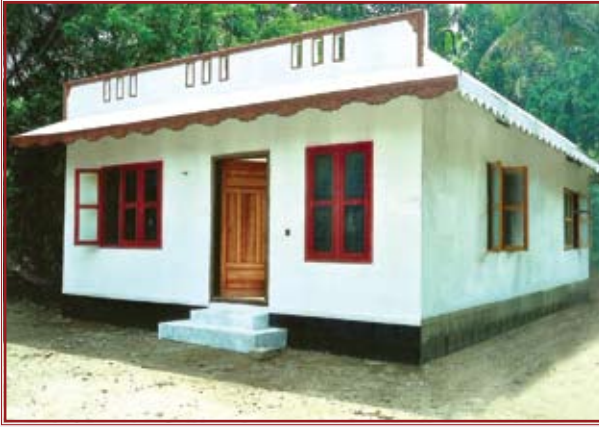
MONACHEN P.G (Cathedral Roll. No. 2029) PULIMOOTIL KATTIL PADEETTETHIL VALIAKULANGARA P.O, KULANJI ,KARAZHMA MAVELIKARA