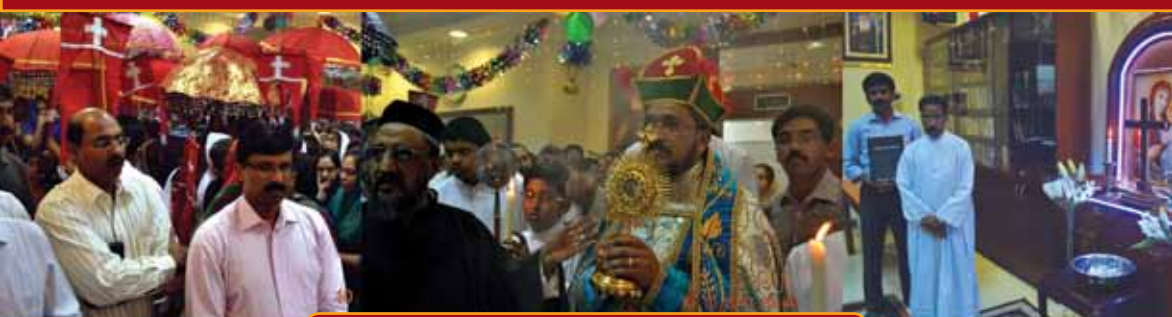
Cathedral Dedication Day 2013