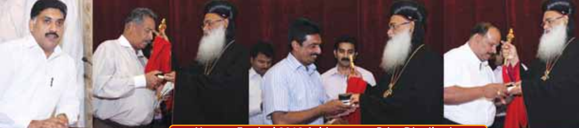
Harvest Festival 2012 Achievement Prize Distribution