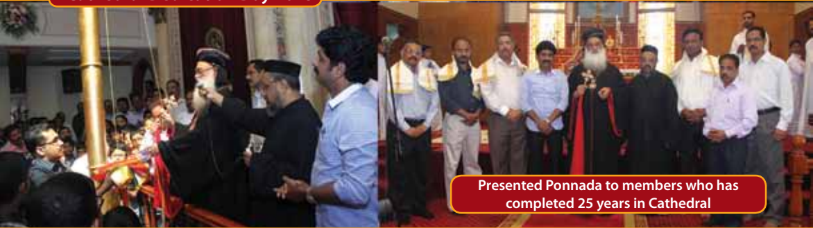
Presented Ponnada to members who has completed 25 years in Cathedral