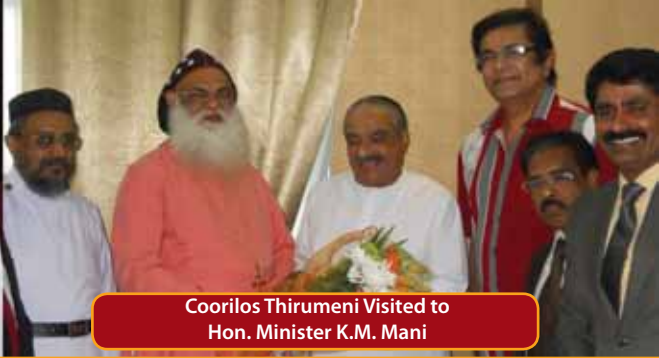
Coorilos Thirumeni Visited to Hon. Minister K.M. Mani