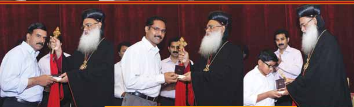
Harvest Festival 2012 Achievement Prize Distribution