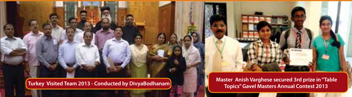
Turkey Visited Team 2013 - Conducted by DivyaBodhanam