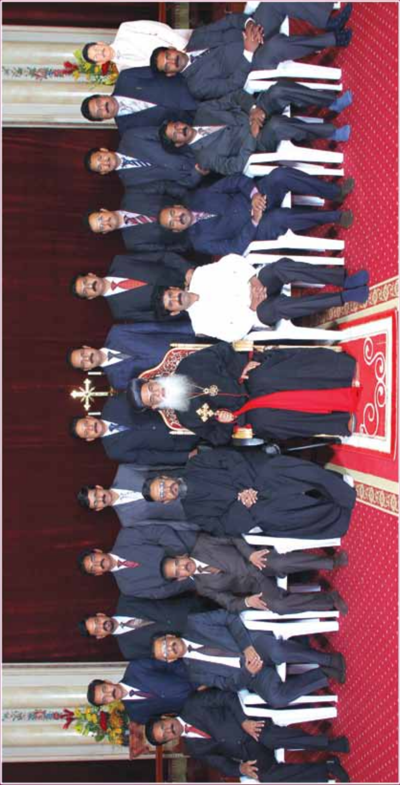
MANAGING COMMITTEE 2013