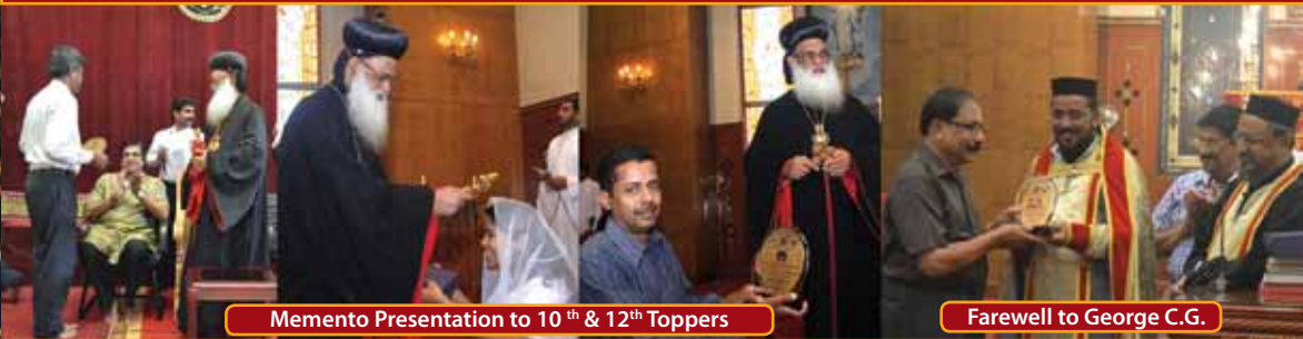
Memento Presentation to 10 th & 12 th Toppers