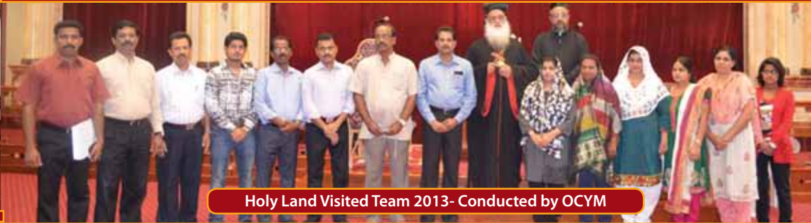
Holy Land Visited Team 2013- Conducted by OCYM