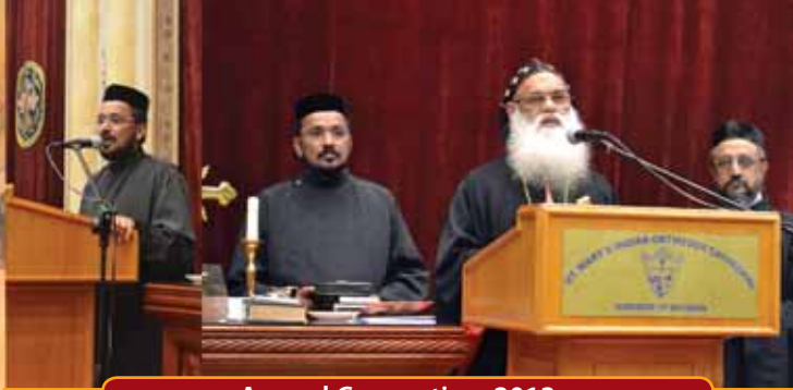
Annual Convention 2013