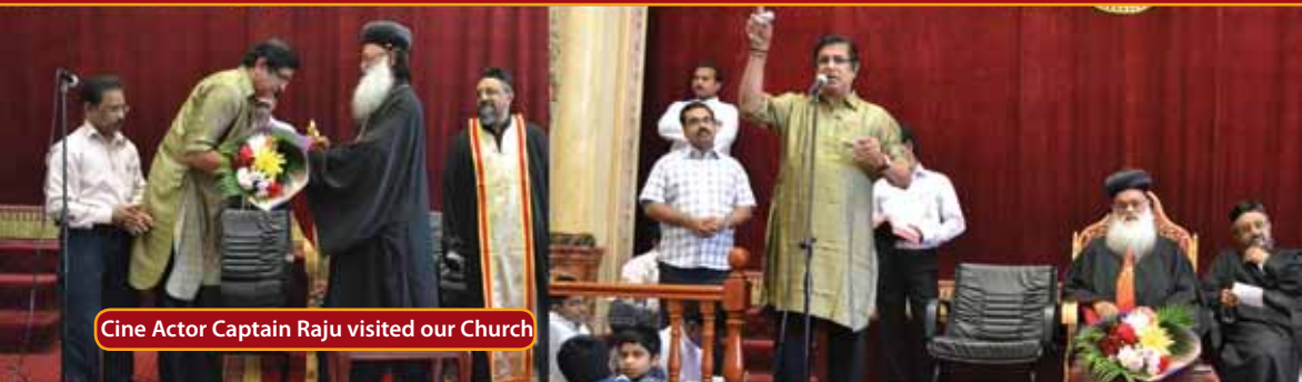
Cine Actor Captain Raju visited our Church