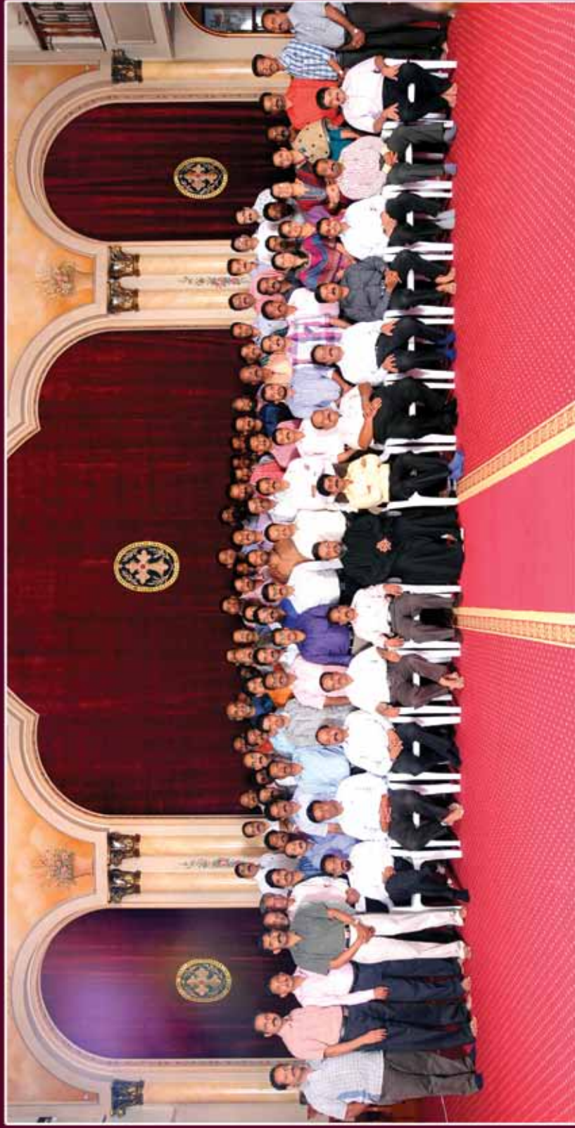
HARVEST FESTIVAL 2013 COMMITTEE