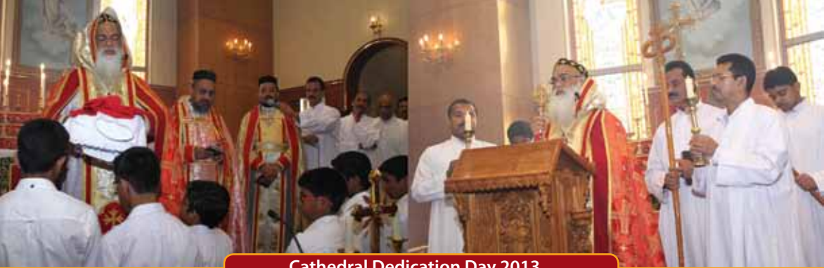
Cathedral Dedication Day 2013