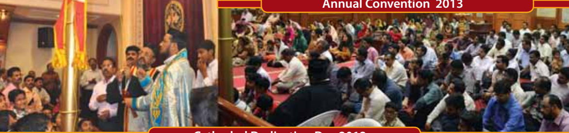
Cathedral Dedication Day 2013