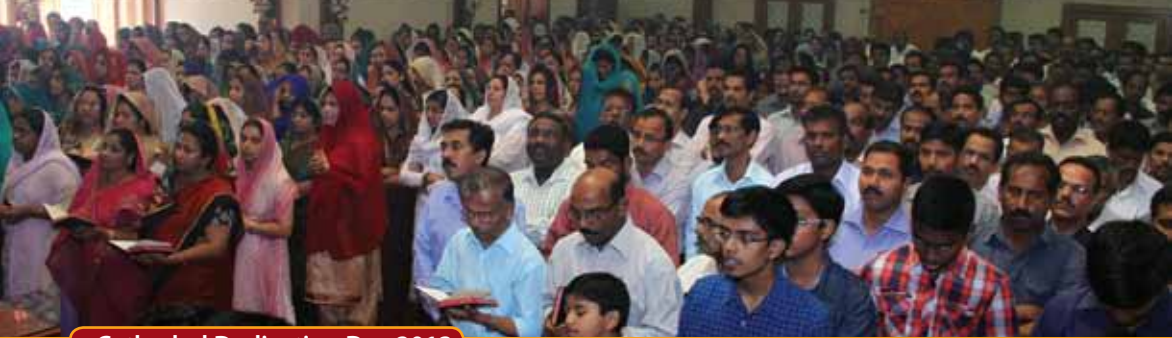
Cathedral Dedication Day 2013