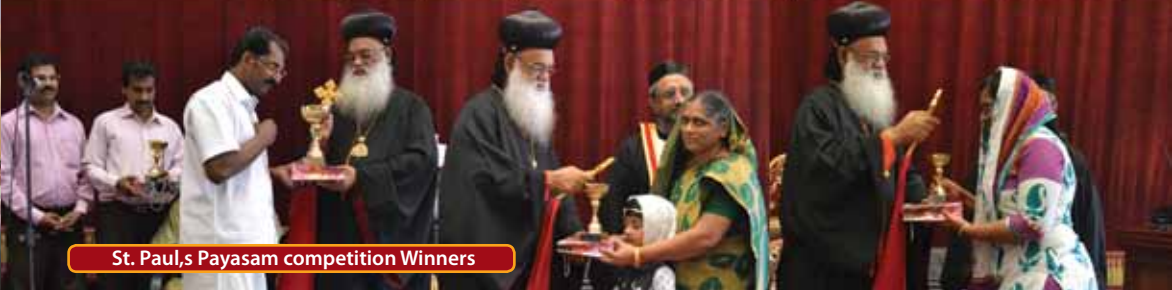
St. Paul's Payasam competition Winners