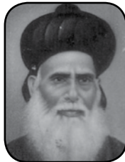
H.H. Baselios Geevarghese I Catholicos (1925-1928)

ദീപ പ്രഭ ചൊരിയുന്ന മെഴുകുതിരികളും, തിരുപിറവിആലംബ്യതമായ പൂൽകൂടുകളുമായി നമുക്ക് ഉണ്ണിയേശുവിനെ വരവേൽക്കാം. സ്നേഹത്തിന്റെയും സമാധാനത്തിന്റെയും പ്രഭ അനർഗളമായി ചൊരിയുന്നതിനു രക്ഷകന്റെ ജനനപെരുന്നാൾ നമുക്ക് പ്രചോദനമാകട്ടെ യെന്ന് ആശംസിക്കുന്നു