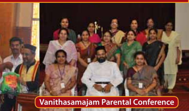
Vanithasamajam Parental Conference