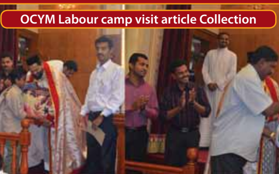
OCYM Labour camp visit article Collection