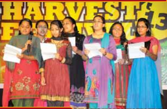
HARVEST FESTIVAL 2013