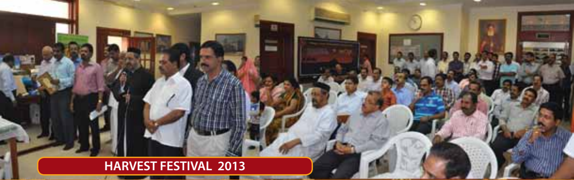
HARVEST FESTIVAL 2013