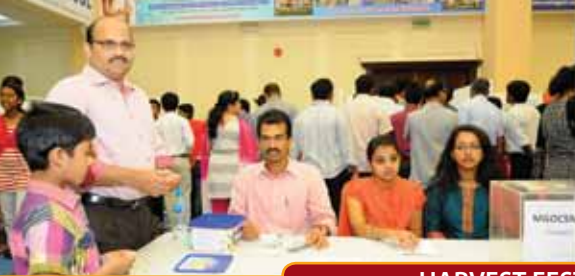
HARVEST FESTIVAL 2013