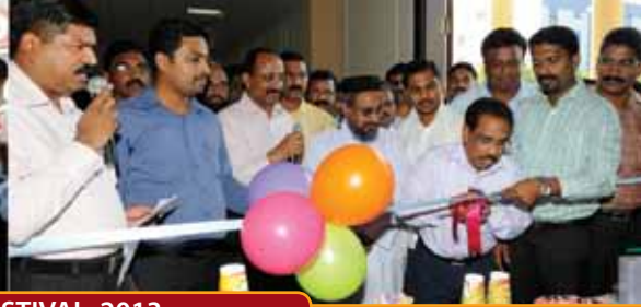
HARVEST FESTIVAL 2013