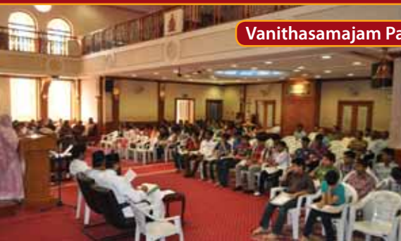
Vanithasamajam Parental Conference