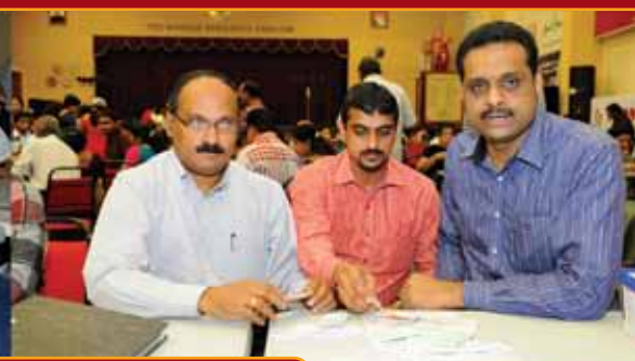
HARVEST FESTIVAL 2013