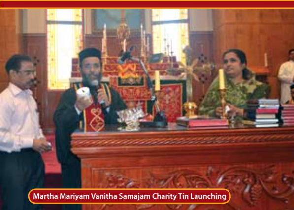
Martha Mariyam Vanitha Samajam Charity Tin Launching