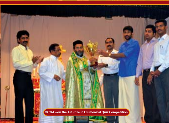
OCYM won the 1st Prize in Ecumenical Quiz Competition