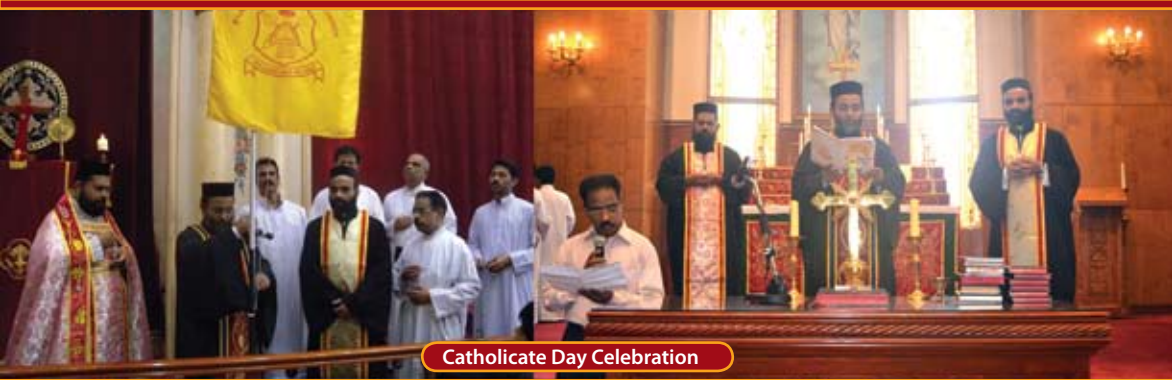
Catholicate Day Celebration