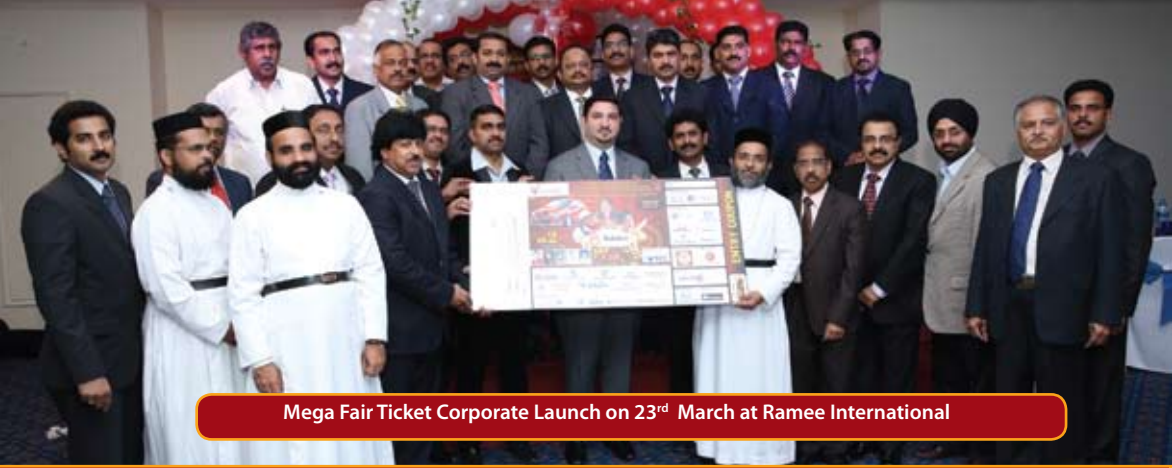
Mega Fair Ticket Corporate Launch on 23 rd March at Ramee International