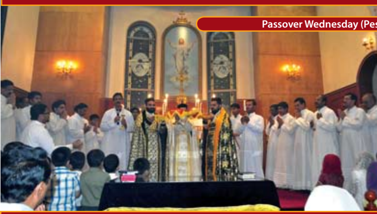
Passover Wednesday (Pesaha)