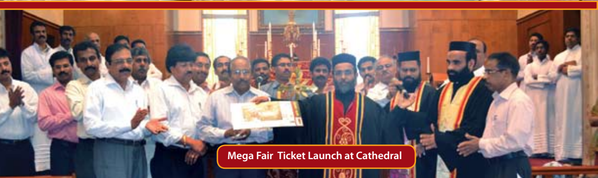
Mega Fair Ticket Launch at Cathedral