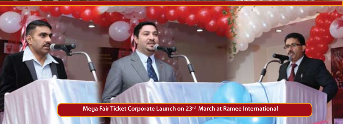
Mega Fair Ticket Corporate Launch on 23 rd March at Ramee International