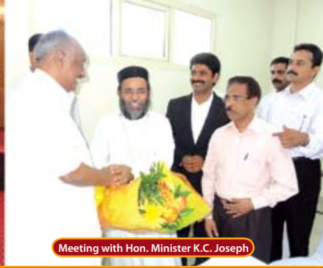
Meeting with Hon. Minister K.C. Joseph