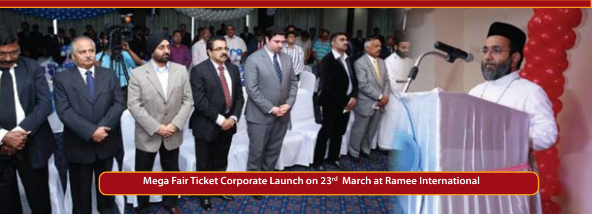
Mega Fair Ticket Corporate Launch on 23 rd March at Ramee International