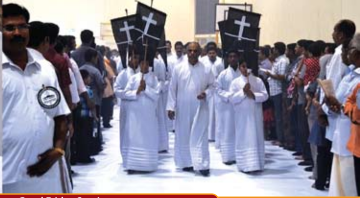
Good Friday Service