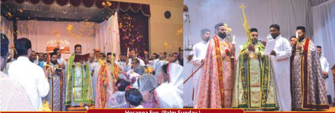
Hosanna Eve. (Palm Sunday)