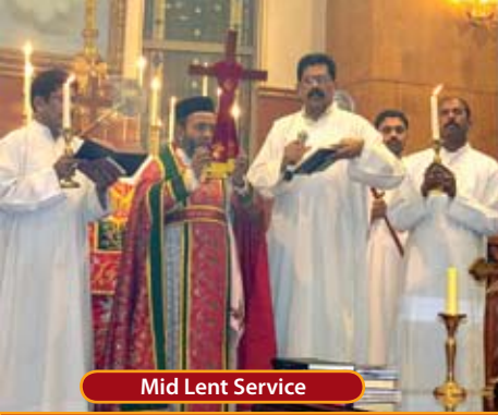
Mid Lent Service