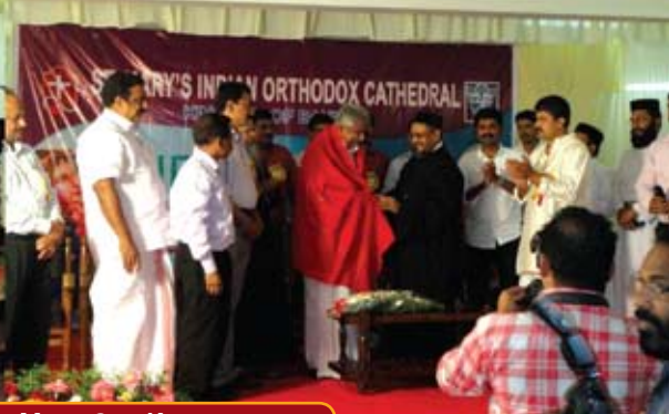
Indo Bahrain Family Meet-2 at Kottayam