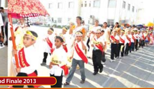
OVBS Grand Finale 2013