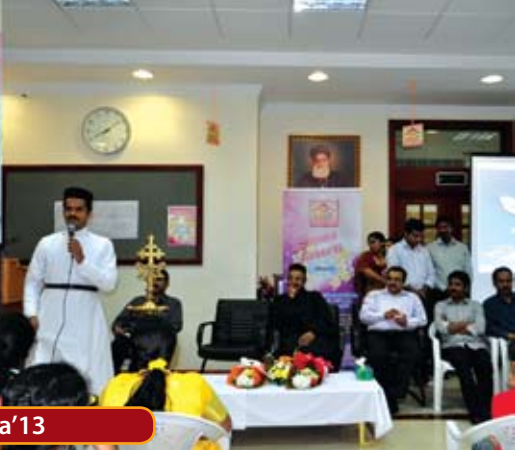
Summer Fiesta '13