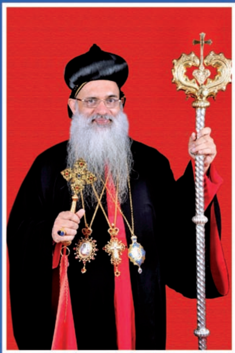
H.H. Baselius Mar Thoma Paulose II Catholicos of The East & Malankara Metropolitan

WELCOMING THE SUPREME HEAD OF THE INDIAN ORTHODOX CHURCH TO OUR CATHEDRAL