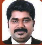
Binu Veliyil Mathew Church South