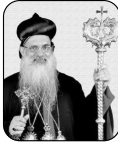
H. H. Moran Mar Baselios Marthoma Paulose II (Catholicose of East & Malankara Metropolitan)

പവിഴ്ജീവിലേക്ക് എഴുന്നള്ളുന്ന അഭി: പിതാക്കന്മാർക്ക് കത്തീഡ്രലിലേക്ക് ന്യാനന്തം