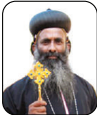
അഭി: ഔഹാനോൻ മാർ കോളിക്കരകോസ് അങ്കമാലി ഭദ്രാസനാധിപൻ (നാശ രക്ഷയ്ക്കായ് ശ്ലാഘിക്കുമാരുടെ മുഖ്യകർമ്മികൻ)