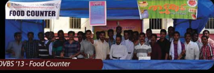
OVBS '13 - Food Counter