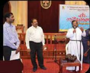
Sargotsav '13 - Quiz Competition, August