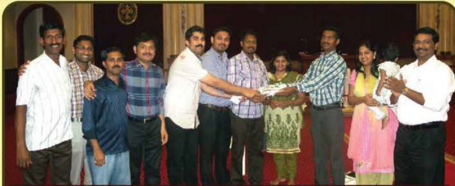
Brain Teaser Competition