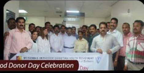
World Blood Donor Day Celebration