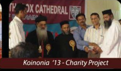
Koinonia '13 - Charity Project