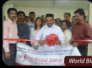
World Blood Donor