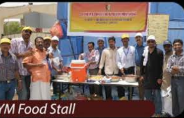
Mega Fair - OCYM Food Stall