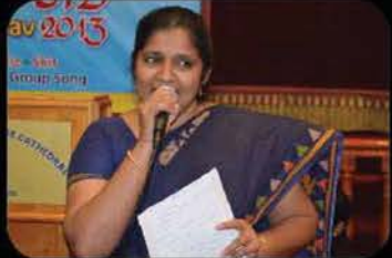
Sargotsav '13 - Quiz Competition, June