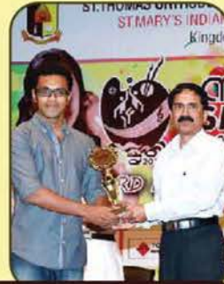
World Blood Donor Day Celebration - Quiz & Caption Contest Winners