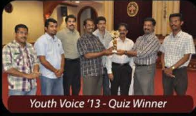
Youth Voice '13 - Quiz Winner