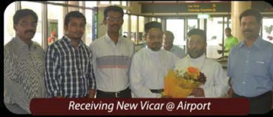
Receiving New Vicar @ Airport