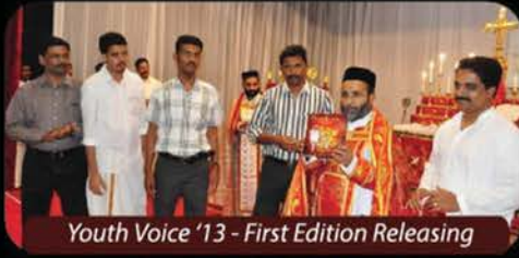
Youth Voice '13 - First Edition Releasing