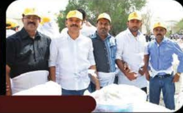
Good Friday - Nercha Distribution