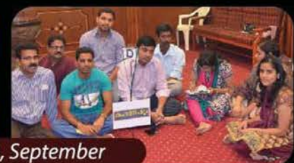
Sargotsav '13 - Bible Verses Competition, September