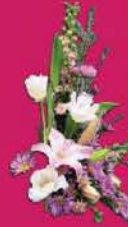
Late Lamented Geevarghese Mar Ivanios