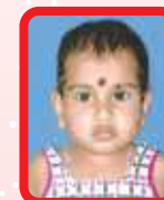
Rosemary 1.3 years