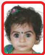
Amithra 6 months