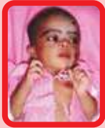
D/o Sruthy 28 Days