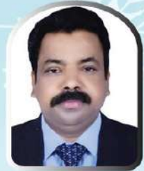
Binoy George Church Area South 39238053