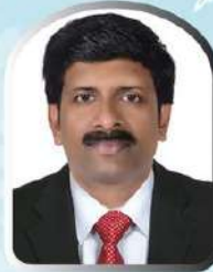
Blessen Koshy Church Area North 39972090